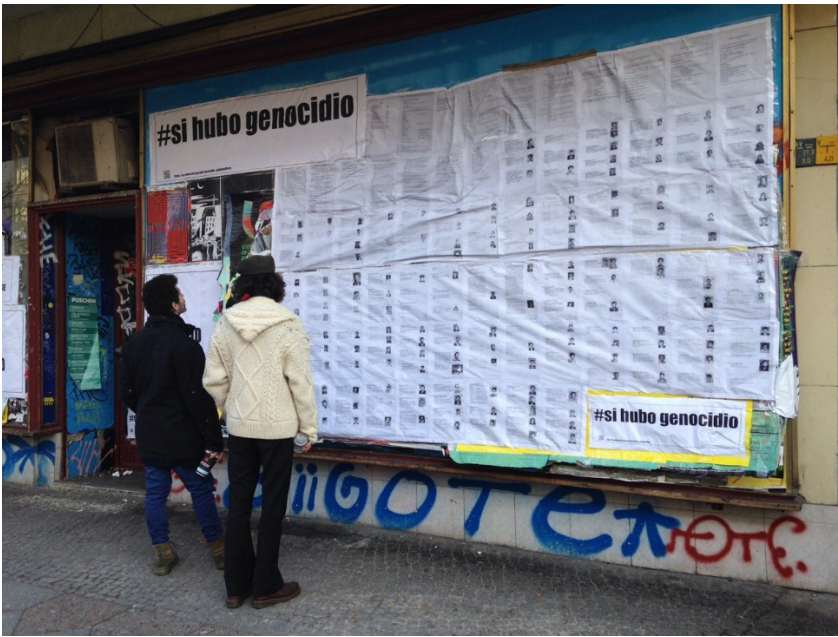
Berlin, Kottbusser Damm 65-66.